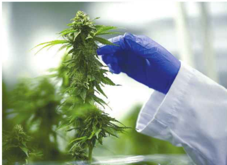
חברה מתכננים לשווק את תכשיריה כתרופות ללא מרשם